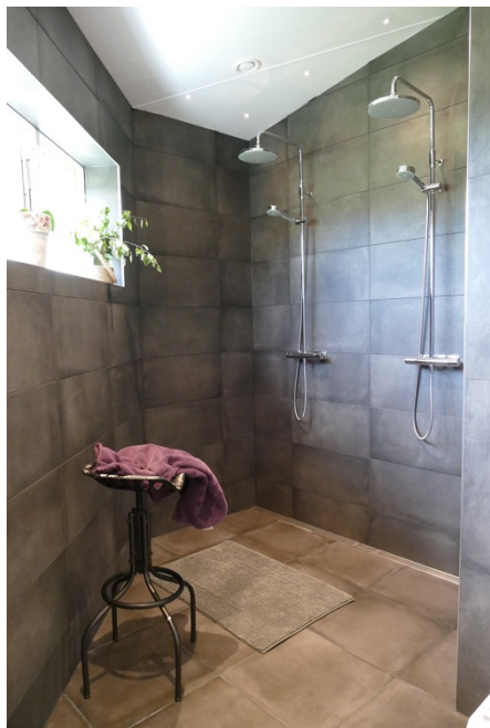
Mora REXX Shower system kit, minimalistisk med enkelhet i fokus.