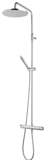
Mora Inxx Shower System kit med reversibelt överstycke.