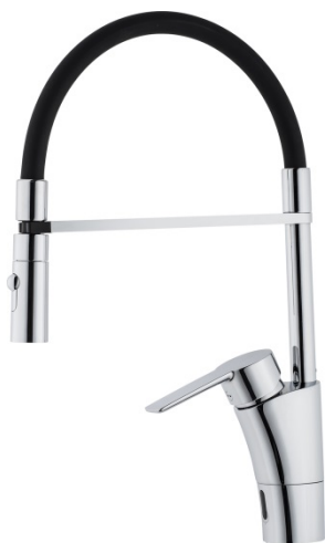
Mora Cera Duo Miniprofi, en elektronisk storköksinspirerad blandare.

Medelantalet anställda uppgick till 506 (534) under perioden.