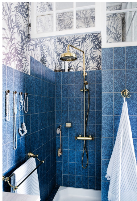
Damixa Tradition takduschpaket finns nu också i mässing. Sen tidigare finns också tvättställs- och köksblandare samt tillbehör med samma ytbehandling.

Denna delårsrapport i sammandrag för koncernen har upprättats i enlighet med IAS 34 Delårsrapportering samt tillämpliga bestämmelser i årsredovisningslagen. Delårsrapporten för moderbolaget har upprättats i enlighet med årsredovisningslagen kapitel 9, Delårsrapport. För koncernen och moderbolaget har samma redovisningsprinciper och beräkningsgrunder tillämpats som i den senaste årsredovisningen.