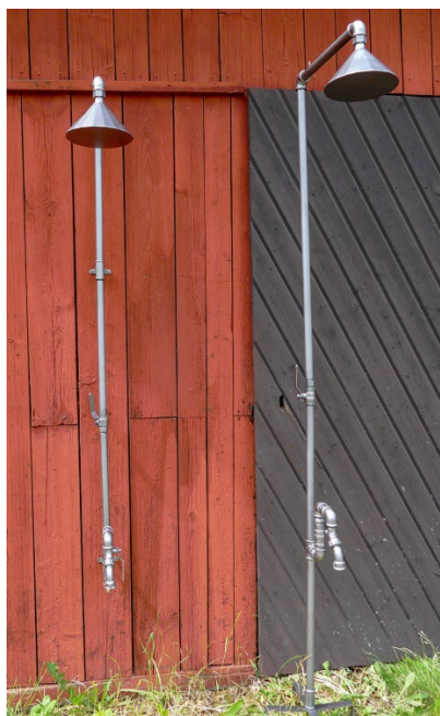
En utedusch i två modeller – en väggfast och en fristående – lanserades i det nya designsamarbetet Mora Armatur by Inredningsrör.

” FM Mattsson Mora Group spelar en viktig roll för att utveckla ett hållbart och energieffektivt sortiment. Vi har jobbat länge för att säkerställa att våra produkter kan skapa tydliga kundnyttor, bland annat att minska vattenförbrukningen ”