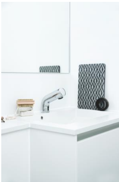
Den första elektroniska blandaren Damixa Free mötte marknaden i december 2016.

FM Mattsson Mora Group lämnar ingen prognos för 2017.