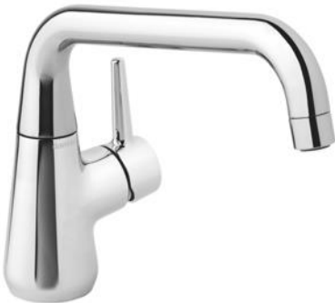
Damixa Bell lanserades i november 2016