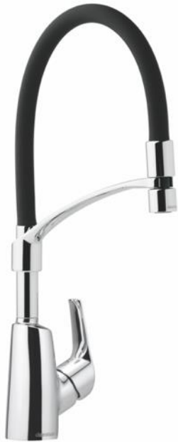
Damixa Rowan Pro lanserades i oktober 2016

Moderbolagets investeringar i materiella anläggningstillgångar uppgick till 48,1 Mkr (13,6) och avser huvudsakligen produktionsanläggningen i Mora. Investeringar i immateriella anläggningstillgångar uppgick till 1,9 Mkr (5,4).