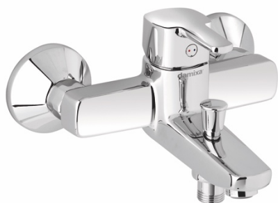
Damixa Pine kar- och duschblandare lanserades i april 2017.

Medelantalet anställda uppgår till 534 (553). Antalet visstidsanställda har minskat med 23 jämfört med föregående år.