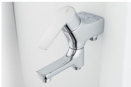
Mora Cera ettgreppsblandare för kök, dusch och bad lanserades i juni 2017.