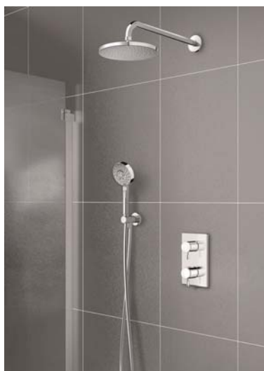
Under kvartalet lanserades Damixas inbyggnadslösning.

” Jag och mina kollegor är stolta över vår historik men fokuserar fullt ut på framtiden och hur vi kan utveckla verksamheten. ”