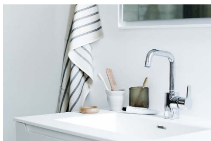
En förstärkning i Pine-familjen – en tvättställsblandare med hög pip.