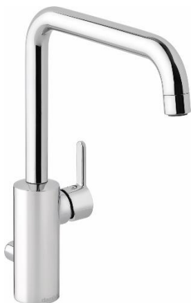
Den nya Damixa-serien Silhouet är designad av den danska designduon Halskov och Dalsgaard.